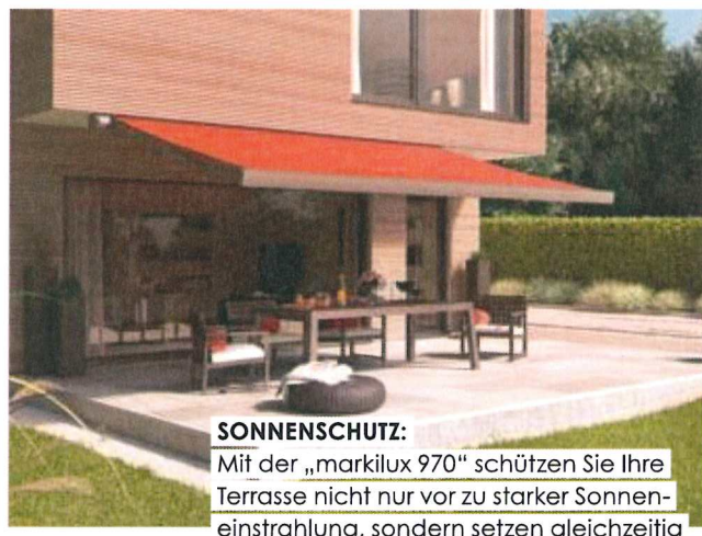
SONNENSCHUTZ: Mit der „markilux 970“ schützen Sie Ihre Terrasse nicht nur vor zu starker Sonneneinstrahlung, sondern setzen gleichzeitig erfrischend bunte Farbakzente. Markilux

Antike Formen wie Säulen, Arkaden oder Balustraden vermitteln zwar traditionelles Flair, könnten aber in Kombination mit der soliden geradlinigen Bauweise deutscher Häuser künstlich wirken. Daher gilt beim Einsatz von gestalterischen Elementen je nach Bauweise das Motto: Weniger ist manchmal mehr. Übrigens auch in punkto Spalierre, Pergolen, Geländer und Gartenmöbel. Hierbei sollten Sie auf filigranes geschmiedetes Metall zurückgreifen. Auch die Gartenbeleuchtung kann eher schlicht ausfallen, zum Beispiel durch romantische Gusslaternen entlang des Kiespfades. Zudem genügen nur ein paar wenige dekorative Hingucker wie gemusterte oder cremefarbene Sitzpolster, eiserne Kerzenständer oder die obligatorischen Terrakotta-Gefäße, um das mediterrane Ambiente abzurunden. Dann fehlt nur noch eine gute Flasche Wein mit Weißbrot und Oliven und der Sommer-Urlaub auf der eigenen Terrasse kann kommen! ■